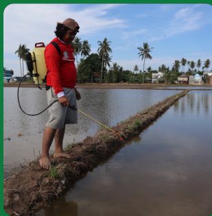
Lahan tergenang air