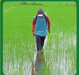
Di dalam air